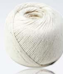
1 metr taśmy