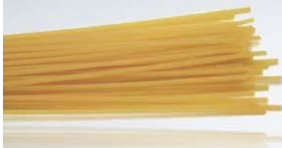
20 spaghetti metr sznurka